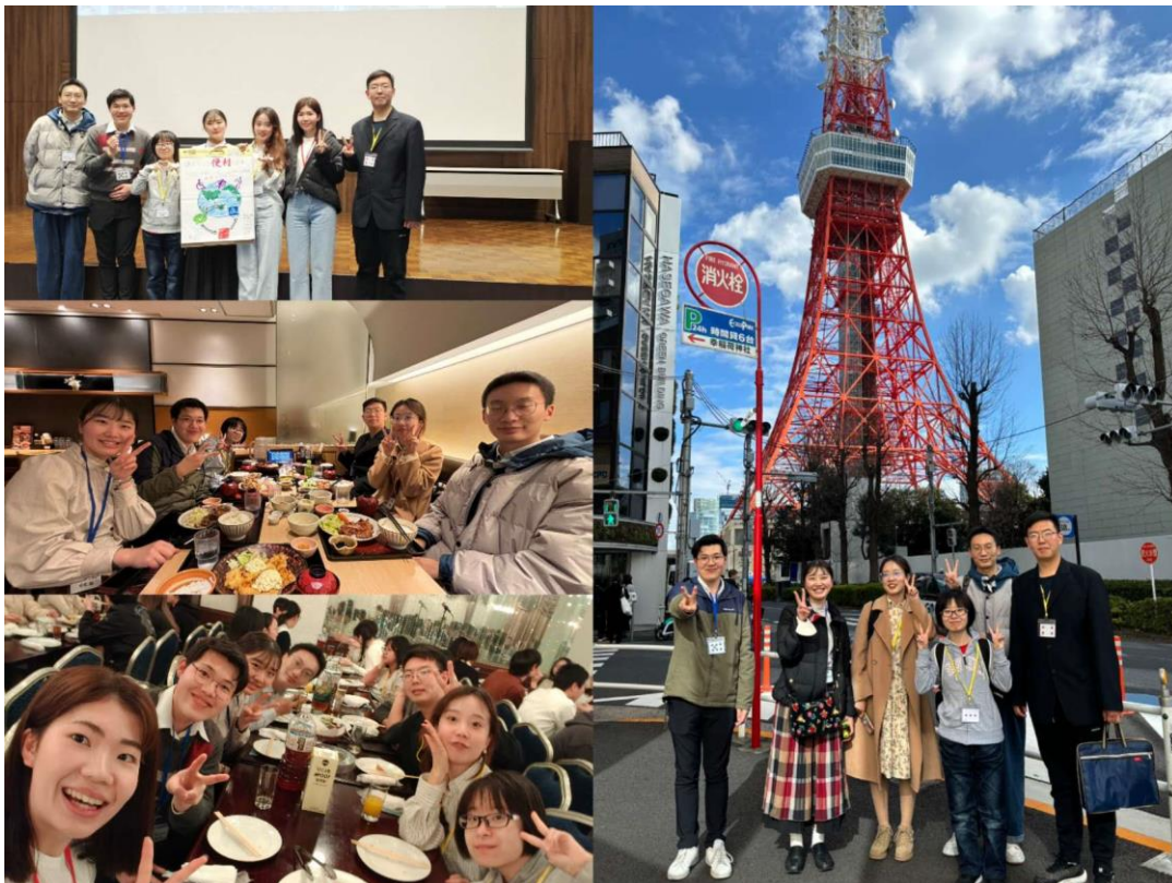
中日両国の友人で構成された「東京 02」班