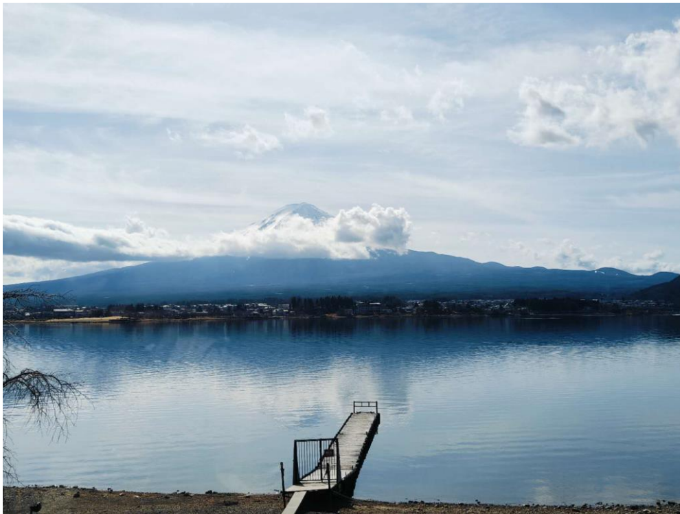
河口湖のほとりから臨む富士山