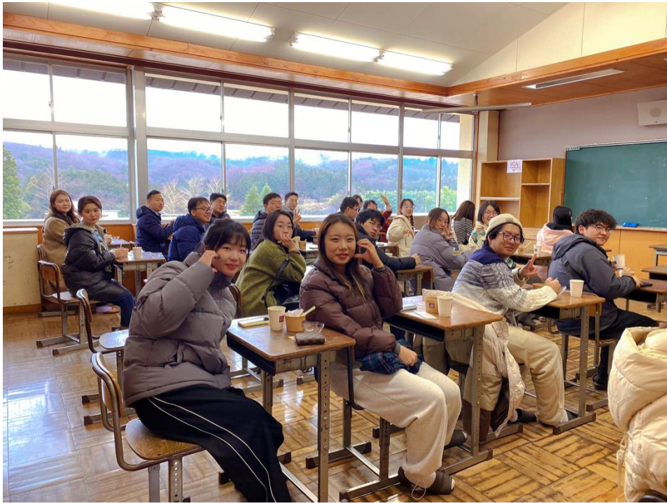
モンブランを味わう体験