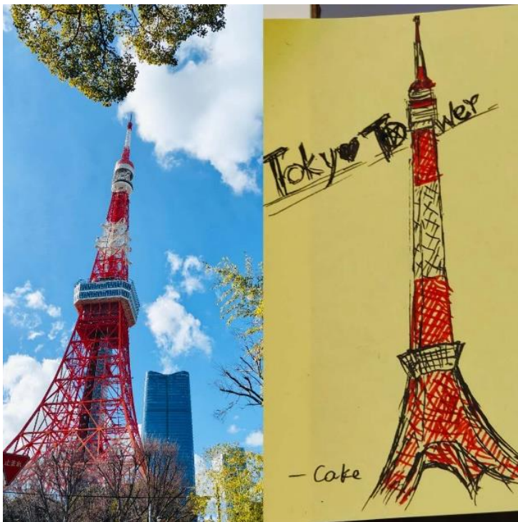
青空の下の東京タワー

道中では赤白に配色された東京タワーが見え、東京の晴れ渡った青空と非常に美しい都市の景観を構成していました。観光客がたくさんいる浅草寺、増上寺、稲荷神社といった宗教施設の見学では、都市生活と高度にからみ合った宗教文化を感じました。日本の仲間の案内で新宿御苑に行くと、心をこめて剪定された花と木の下には遊覧客で「埋め尽くされた」黄色い芝生があり、そこに加わって、そよ風の中で中国語と日本語をまぜこぜにして談笑しました。河口湖のほとりから遠くの富士山を眺めると、富士山の気質は静謐にして清浄で、日光を反射してできた無形のハロは人の心のすべての隅を照らしているかのようでした。若山農場の竹林では、しとしとと小雨が降っており、その中をそぞろ歩きしてお茶を味わうと、お茶請けの栗菓子がとても甘く、そうしたどれもが特別な思い出です。その過程で、同行した中日両国の友人といっしょに美しい景色を楽しみ、美食を味わい、経験を分かち合い、未来を語り合いました。